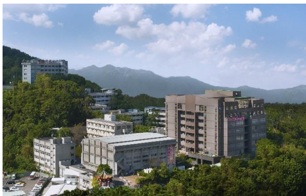
臺北校區 Taipei Campus