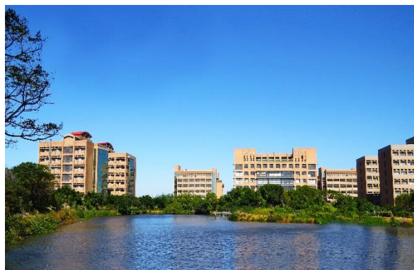
新竹校區 Hsinchu Campus